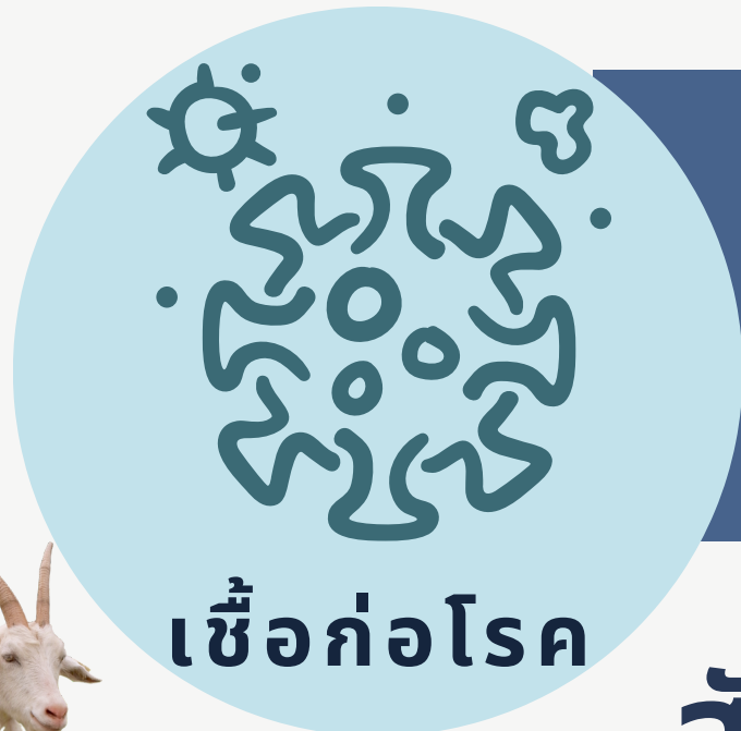
เชื้อก่อโรค