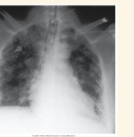
ภาพถ่ายX-ray ปอดแสดงหนองในปอด