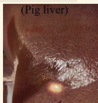
ภาพตับและปอดสุกร ที่ตรวจพบฝักหนอง ของเชื้อเมลิโออยด์ ที่นำ: คู่มือโรคเมลิโออยด์ กรมควบคุมโรค