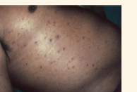
ภาพตุ่มหนองที่ผิวหนังในผู้ป่วยด้วยโรคเมลิโออยด์